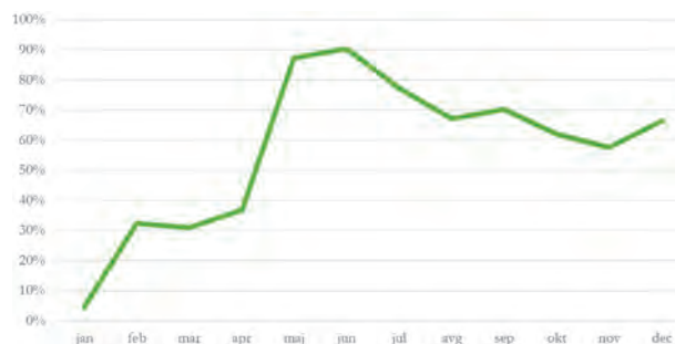
Slika 3 Podatki o deležu pomoči uporabnikom za rešitev zVEM v letu 2021.