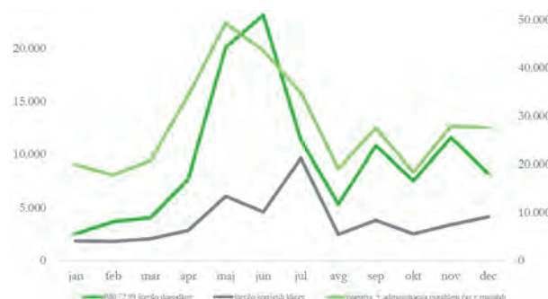
Slika 2 Podatki o uporabi pomoči uporabnikom rešitev eZdravja po mesecih v letu 2021.