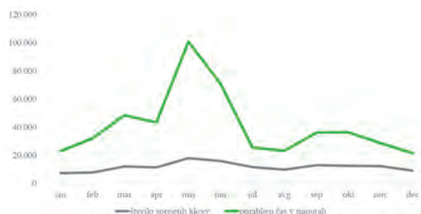
Slika 5 Podatki o uporabi pomoči za e-naročanje.

V času epidemije je center za pomoč uporabnikom prejemal vprašanja, povezana z zdravjem, vprašanja o bolezni COVID-19, vprašanja o zdravljenju in zdravilih, vprašanja o cepljenju, cepivih in stranskih učinkih. Poleg tega so se pacienti obračali na klicni center z vprašanji o veljavnih ukrepih in omejitvah gibanja. S tem se je zameglil pravi namen centra za pomoč, namreč podpora uporabnikom rešitev eZdravja.