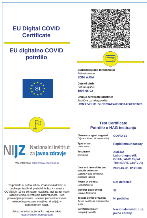
SLIKA 2: EU DCP O NEGATIVNEM HITREM TESTU

V Povzetku podatkov o pacientu , ki vsebuje najpomembnejše zdravstvene zapise pacienta, se v primeru pozitivnega rezultata na vrhu izpisa pokaže opozorilo. Čas prikaza opozorila je omejen na 3 tedne. Opozorilo pomeni, da je bil na navedeni datum rezultat testa pozitiven, bodisi s PCR testom bodisi s HAGT. V primeru, da je pozitivnemu rezultatu na pozneje sledil negativni test, se opozorilo ne umakne. Dokument je dostopen zdravnikom in drugim zdravstvenim delavcem, ki imajo preko svojih lokalnih informacijskih sistemov omogočene poizvedbe v CRPP.